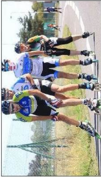
Les participants devaient parcourir une boucle de 2,8 km entre le parc des expositions et la rue Lavoisier.