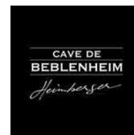
Cave de Beblenheim