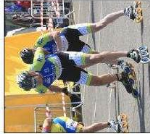
Passage de relais dans les régles de l'art.