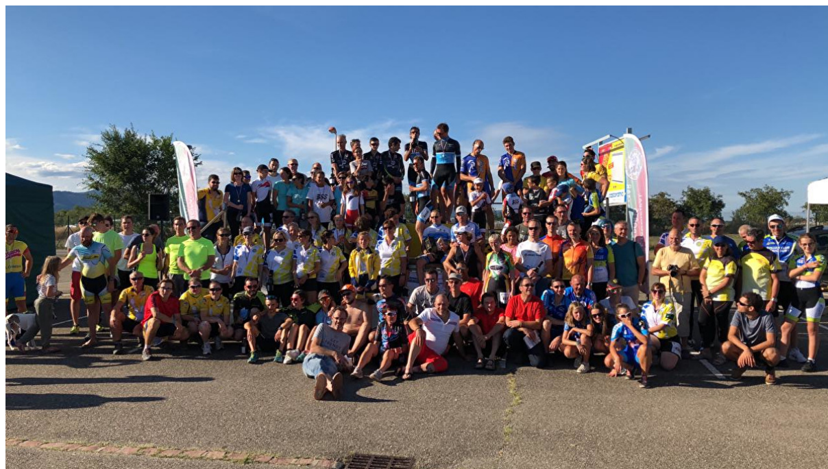
Photo de groupe