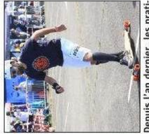
Depuis l'an dernier, les pratiquants de longboard peuvent participer.

trentaine de non licenciés ont également chausé leurs rollers.