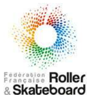
Fédération Française de Roller et Skateboard