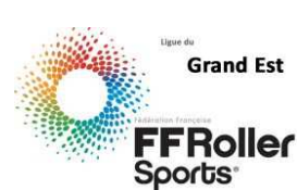
Ligue du Grand Est