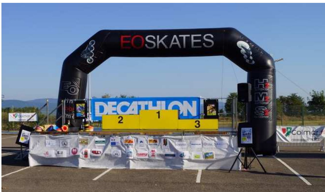
Le podium 2016

Chers partenaires, chers coureurs, chers bénévoles, nous vous réitérons nos remerciements pour avoir contribué à la réussite de cette septième édition et comptons sur votre soutien et votre présence à nos côtés en 2019.