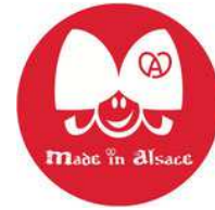
Made in Alsace